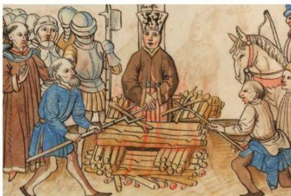
“La ejecución de Jan Hus”