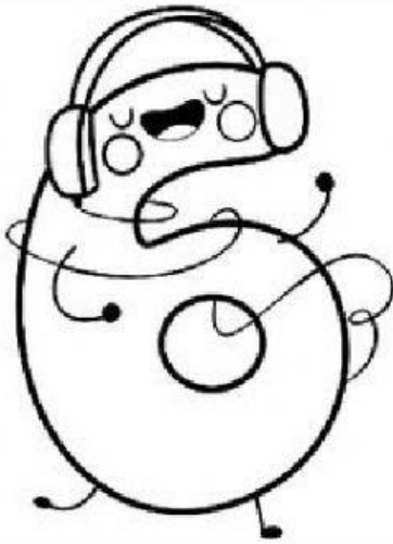
TABLA DEL 6

Colorea los números de la tabla del 6 (puedes ayudarte con las tablas del estuche)