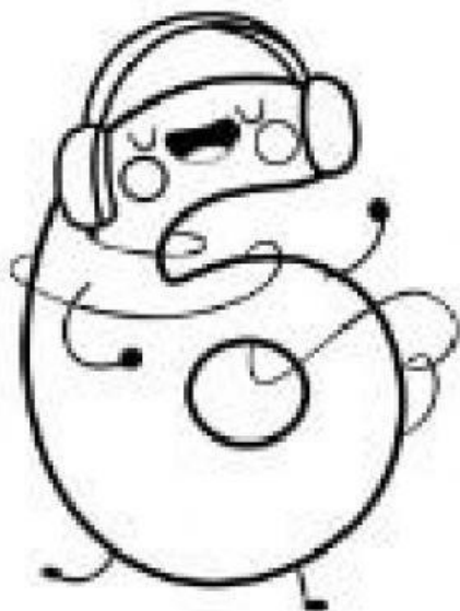
Tabla del 6