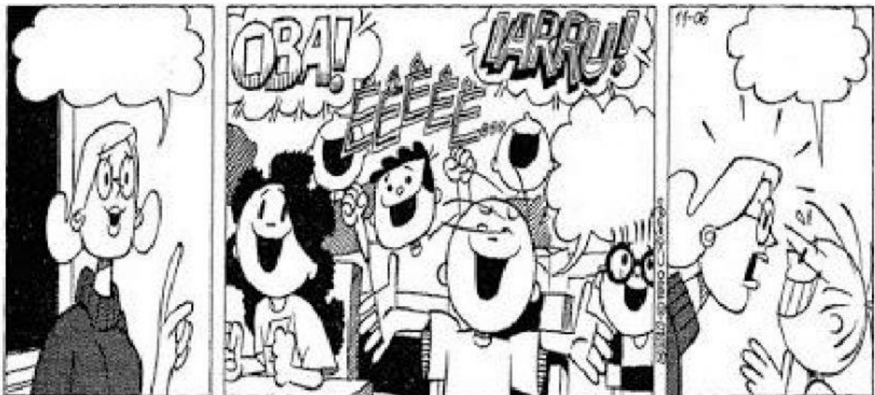
O Menino Maluquinho em quadrinhos, Ziraldo, L&PM.

2 – Invente uma história do Menino Maluquinho de acordo com as imagens e expressões faciais.