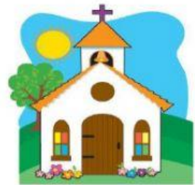
El templo de los cristianos

Existen iglesias diferentes. Selecciona la respuesta correcta