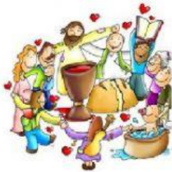
La familia de los cristianos