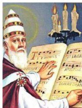
PAPA SAN GREGORIO

2. Eran alabanzas a Dios mediante los Cantos Georgianos. Se canta A CAPELLA, es decir sólo con la voz, sin instrumentos.