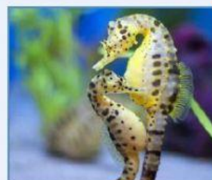
Caballito de mar