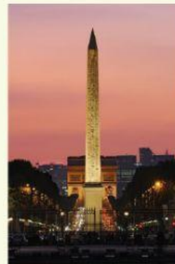
La Place de la Concorde est ____ France ____ Paris.