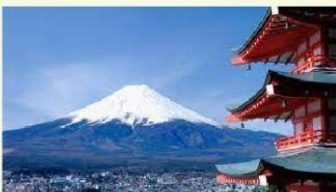
Le Mont Fuji est ____ Japon