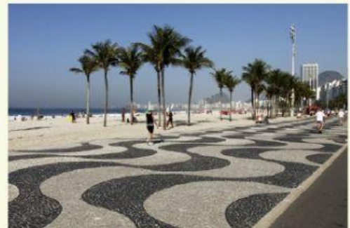
Copacabana est ____ Brésil ____ Rio de Janeiro.