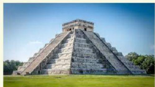
La Pyramide de Kukulcán est ____ Mexique ____ Chichén Itzá.