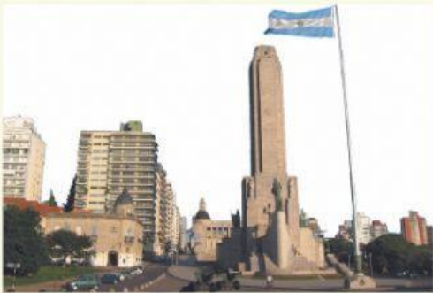
Le Monument au Drapeau est ____ Argentine ____ Rosario.