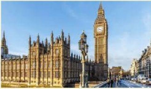
Le Big Ben est ____ Angleterre ____ Londres

Observez les images et complétez les phrases avec les prépositions correctes.