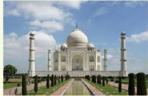
Le Taj Mahal est ____ Inde ____ Agra.