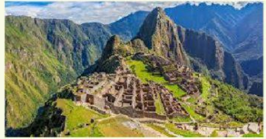
Le Machu Picchu est ____ Pérou ____ Cuzco.