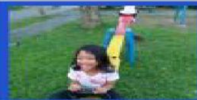
Gambar anak-anak yang sedang bermain di taman di dalam kompleks perumahan.

Contohnya adalah: taman kota, lampu lalu lintas, jalan raya, dan perpustakaan daerah.