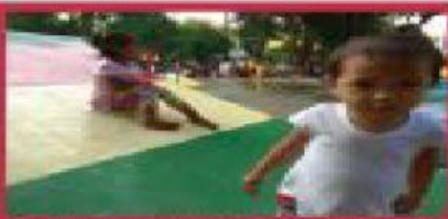
Gambar anak-anak yang sedang bermain di taman kota.

Fasilitas umum adalah fasilitas yang disediakan oleh pemerintah untuk masyarakat umum.