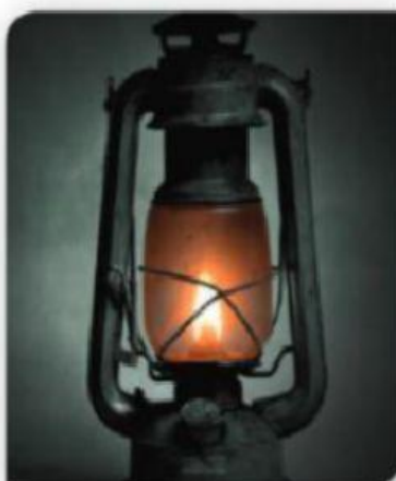
Lampião a gás.