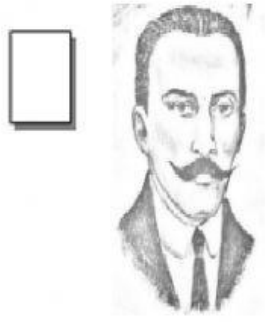
José María Pino Suárez