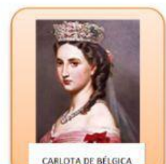
CARLOTA DE BÉLGICA