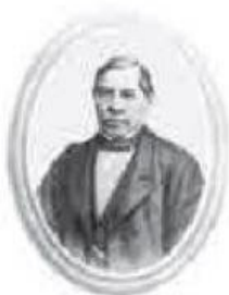
Presidente Benito Juárez (liberal)

COLOCA EL NÚMERO SEGÚN CORRESPONDA AL PRESIDENTE CON LAS ACCIONES QUE REALIZÓ