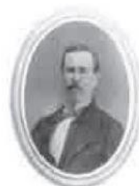
Presidente Félix María Zuloaga: (conservador)

La Guerra de Reforma concluyó con su triunfo.