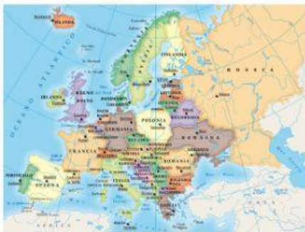
la carta geografica del nostro continente , l'Europa

La carta geografica che rappresenta tutto il mondo si chiama PLANISFERO