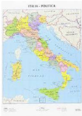
la carta geografica della nostra nazione , l'Italia