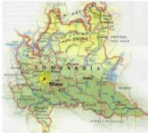
la carta geografica della nostra regione , la Lombardia