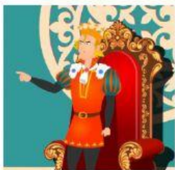
El Rey Juan, era el Sr. Feudal