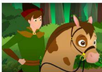
y Robin Hood, fue un noble, que ayudaba a los campesinos.