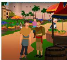
El Sr. Feudal, daba tierras a los aldeanos, estos podían cosechar y vender sus productos.

Los campesinos daban una pequeña parte de lo que ganaban a los reyes, éstos lo utilizaban para las batallas, mejoras del castillo y la aldea.