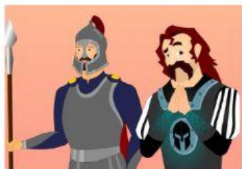
El Sheriff era el encargado de recaudar los impuestos para llevarlo al castillo .