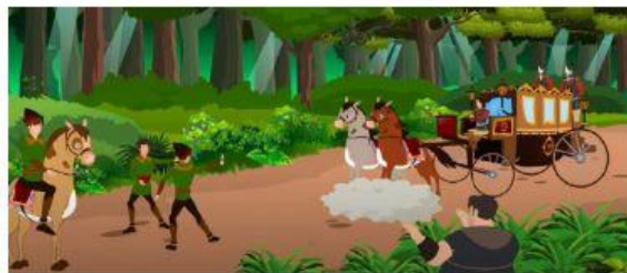
Robaba los impuestos que el Sheriff recaudaba y se los devolvía.