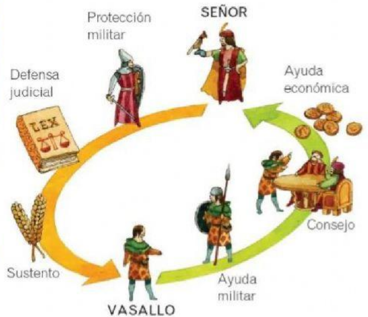
Esquema de las relaciones feudales