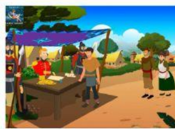
El Rey aumentaba los impuestos a los aldeanos, TODO EL TIEMPO. PROBLEMA