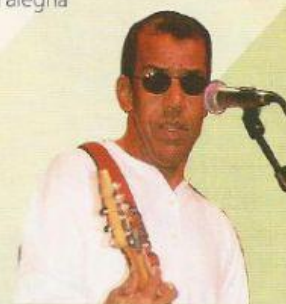
BEN, Jorge. SIMONAL, Wilson. Jorge Ben. Rio de Janeiro: Philips, 1969. 1 LP; estéreo.