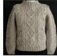
Pemanfaatan bulu domba