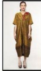
Pemanfaatan ulat sutera