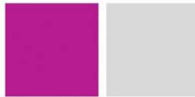
สีม่วงแดง