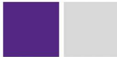
สีม่วงน้ำเงิน