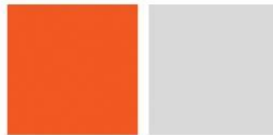
สีส้มแดง