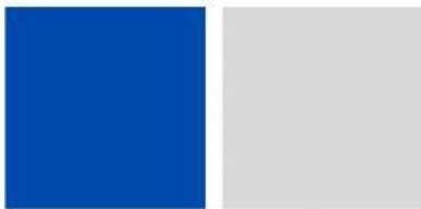
สีน้ำเงิน