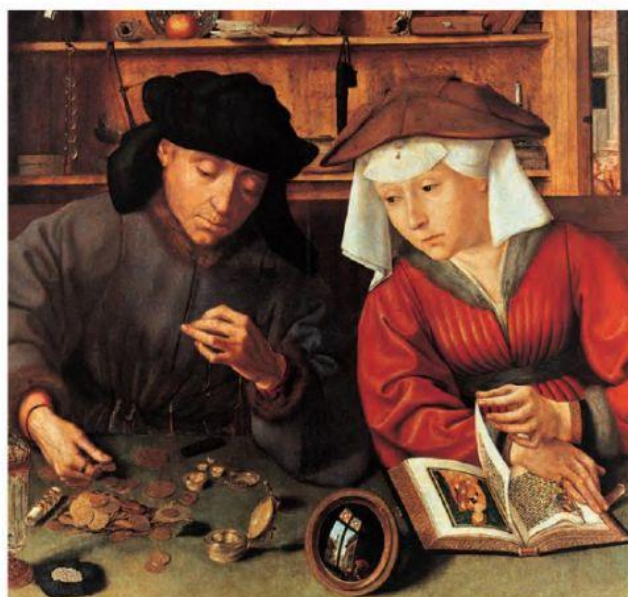
↑ Quintin Massys, El cambista y su mujer . (1514).

✓ Observa la siguiente imagen y luego responde las preguntas 2 a la 4.