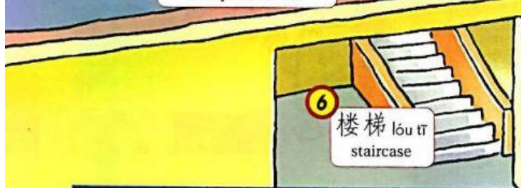
6 楼梯 lóu tī staircase