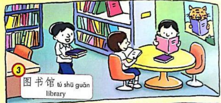
3 图书馆 tú shū guān library