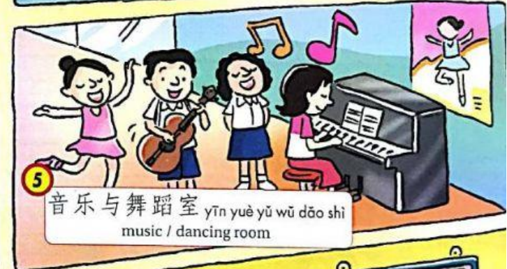
5 音乐与舞蹈室 yīn yuè yǔ wǔ dǎo shì music / dancing room