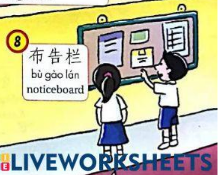
8 布告栏 bù gào lán noticeboard