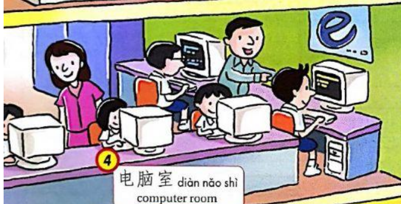
4 电脑室 diàn nǎo shì computer room