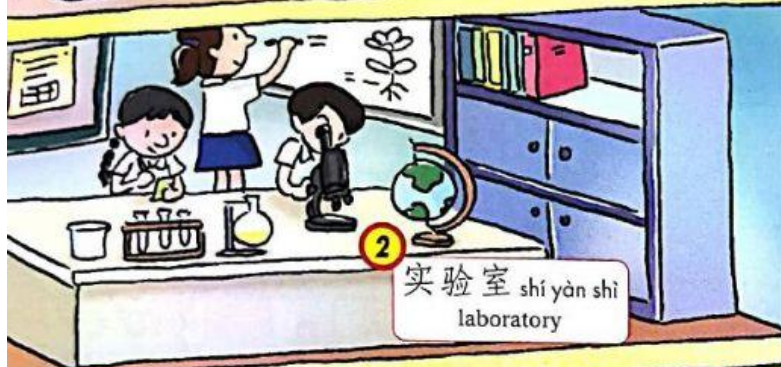
2 实验室 shí yàn shì laboratory