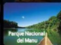
Parque Nacional del Manu