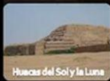
Huacas del Sol y la Luna