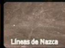
Líneas de Nazca