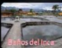
Baños del Inca