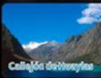
Callejón de Huaylas