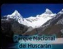
Parque Nacional del Huaracán