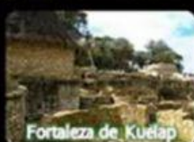
Fortaleza de Kuélap

Los sitios arqueológicos son lugares históricos que representan las evidencias o "huellas" dejadas por las sociedades que vivieron en esos lugares. Son parte del patrimonio cultural.