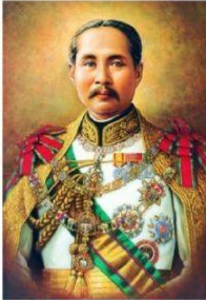
พระบาทสมเด็จพระมงกุฎเกล้าเจ้าอยู่หัว รัชกาลที่ 5

18. ในสมัยรัชกาลที่5ได้มีการปรับปรุงวงปีพาทย์ โดยเรียกว่าวงอะไร?