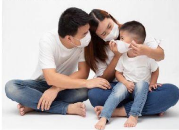
Gambar 1: Keluarga adalah simbol salah satu bentuk kelompok. Di dalam keluarga ini, kita dilahirkan dan dibesarkan

Sosiologi sebagai ilmu yang mempelajari tentang masyarakat tidak akan lepas dari individu serta aktivitas yang dilakukannya, Aristoteles mengemukakan bahwa manusia adalah makhluk sosial ( zoon Politicon ) yaitu bahwa manusia dikodratkan untuk hidup bermasyarakat dan berinteraksi satu sama lain. Sejak manusia dilahirkan di muka bumi pasti memerlukan bantuan dari orang lain, coba perhatikan, seorang bayi ketika lahir dari rahim seorang ibu tentunya mendapat bantuan dari bidan atau dukun bayi. Seorang bayi diberikan kasih sayang oleh orang tuanya dan keluarganya sehingga tumbuh dan berkembang di masyarakat. Hal itu mencerminkan bahwa setiap individu pasti memerlukan orang lain untuk mencukupi kebutuhan jasmani maupun rohaninya.