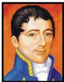
JUAN PABLO VIZCARDO Y GUZMÁN