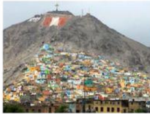
Cerro San Cristobal