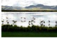
Lago de Junín