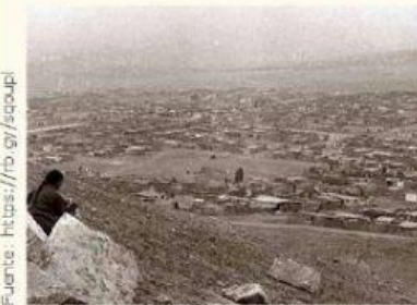
ra, en sus inicios. Villa El

Después de la independencia, la mayoría de la población del Perú vivía en el campo, pero durante estos 200 años, muchas familias han migrado a la ciudad y han construido centros poblados en lugares desiertos. Por ejemplo, en las siguientes fotos podemos apreciar los inicios del distrito de Villa el Salvador en 1971, y una foto de dicho distrito en la actualidad.