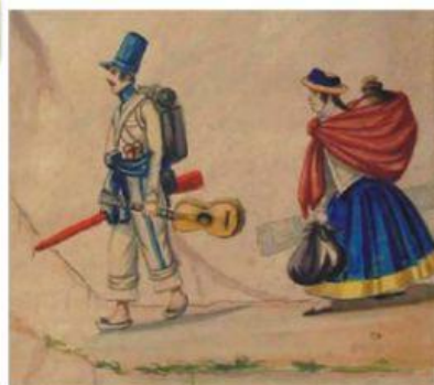
Autor: Pancho Fierro. Obra: El soldado y la rabona

¿Por qué crees que la mujer camina detrás del soldado?