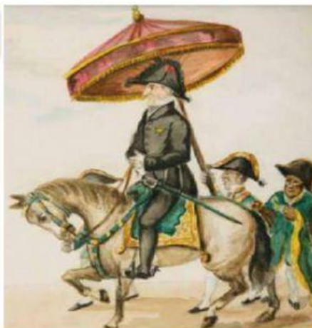
Autor: Pancho Fierro. Obra: El alcalde de primer voto

¿Qué diferencias ves entre las personas que aparecen en la imagen? ¿Qué funciones crees que cumplen?