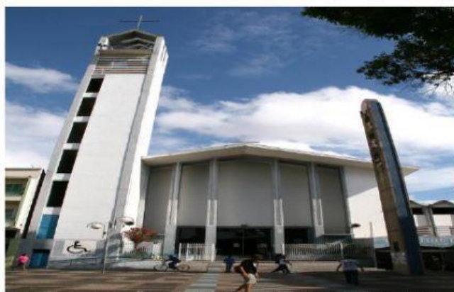
CATEDRAL DO DIVINO ESPÍRITO SANTO BAURU

4- OS PATRIMÔNIOS MATERIAIS: SÃO BENS MÓVEIS PODENDO SER TRANSPORTADOS, COMO UMA OBRA DE ARTE: PINTURA, OU IMÓVEIS DE VALOR ARQUEOLÓGICO E ARTÍSTICOS COMO POR EXEMPLO TEMOS AS IGREJAS, OS PRÉDIOS, AS PIRÂMIDES DO EGITO, O COLISEU ROMANO, O CRISTO REDENTOR NO RIO DE JANEIRO, AS ESCULTURAS, AS BIBLIOTECAS E OS MUSEUS.