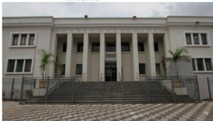
CÂMARA MUNICIPAL DE BAURU