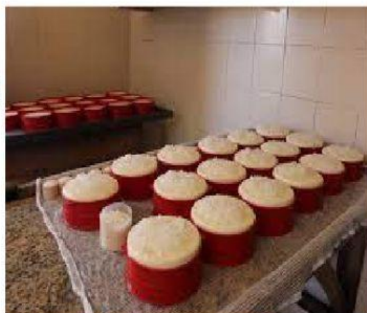
PRODUÇÃO QUEIJO MINEIRO

Atividade elaborada pela professora da sala de recursos, imagens retiradas do site Google