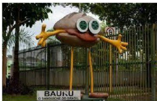
MONUMENTO DO SANDUÍCHE BAURU