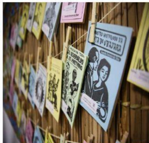
LITERATURA DE CORDEL