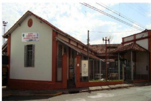
MUSEU FERROVIÁRIO DE BAURU