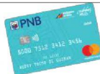
Singular: Plural: die EC-Karten