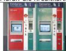
Singular: der Fahrkartenautomat Plural: