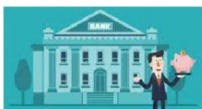
Singular: Plural: die Kontos