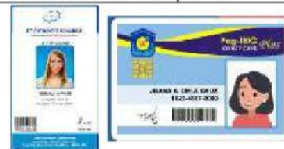
Singular: der Ausweis Plural: