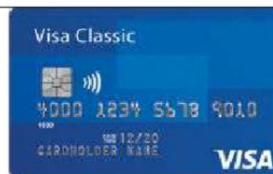
Singular: Plural: die Kreditkarten