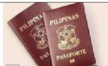
Singular: Plural: die Reisepässe