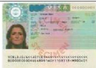
Singular: Plural: die Visa/ die Visen