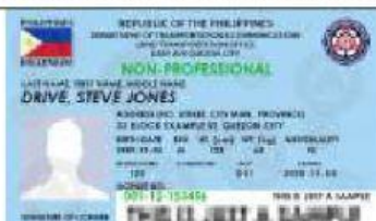
Singular: der Führerschein Plural: