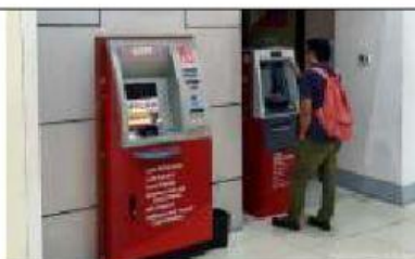
Singular: Plural: die Geldautomaten