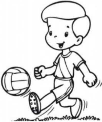
Habilidad en el deporte

Resuelve el crucigrama, todas las palabras terminan en "bilidad". Ilumina al final.