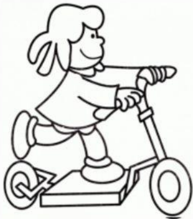
Estabilidad en el patín