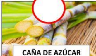
CAÑA DE AZÚCAR