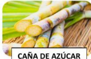
CAÑA DE AZÚCAR