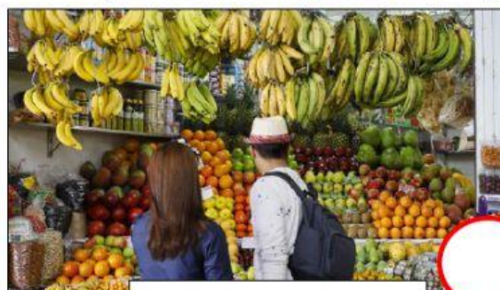
VENTA DE PRODUCTOS