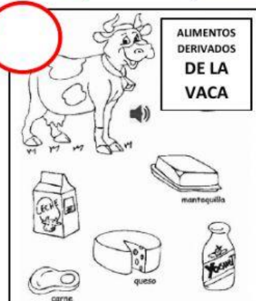
ALIMENTOS DERIVADOS DE LA VACA