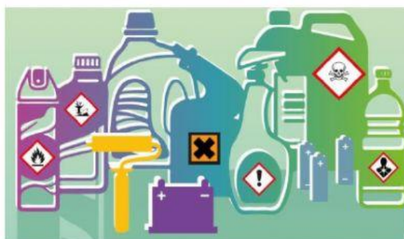
PRODUCTOS DE QUÍMICOS QUE PUEDEN ENTRAR EN CONTACTO CON LOS ALIMENTOS.