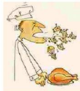
MANIPULADOR ENFERMO QUE TOSE SOBRE EL ALIMENTO