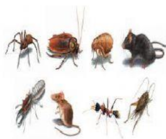
PLAGAS DE INSECTOR U OTROS