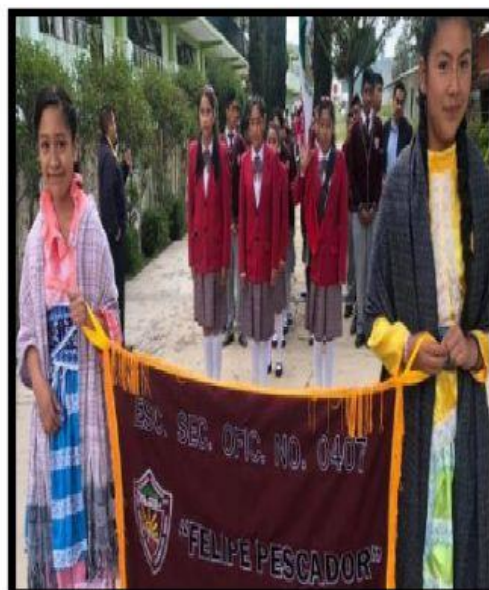
5. _____ from San Antonio Enchisi.