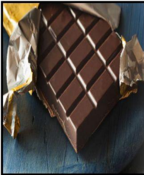
2. _____ delicious.