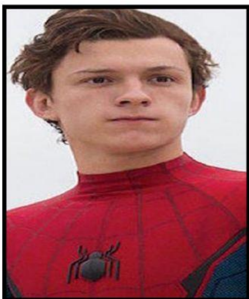
4. _____ an actor.