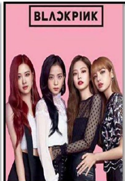
3. _____ blackpink.