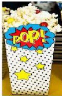
PIPOCA R$ 1,00