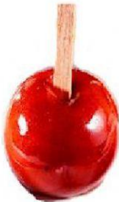
MAÇÃ DO AMOR R$ 2,00