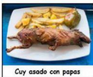
Cuy asado con papas