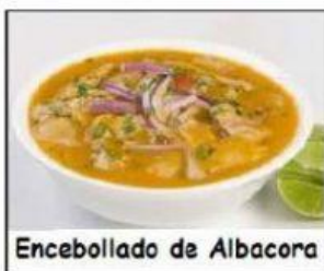
Encebollado de Albacora