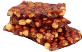
PÉ DE MOLEQUE