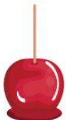
MAÇÃ DO AMOR