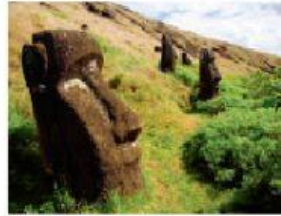
Isla de Pascua.