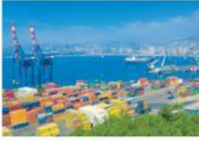
Puerto de Valparaíso.

4. ¿Cuál de estos paisajes corresponde a la Zona Central?