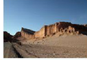
Desierto de Atacama.

5. ¿En cuál fotografía se muestra un paisaje de la Zona Sur?