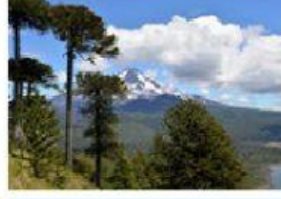
Bosque de araucarias.