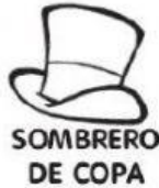
SOMBRERO DE COPA