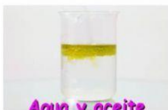
Agua y aceite

3. ¿Cuántas fases observamos en cada mezcla? Clasificarlas