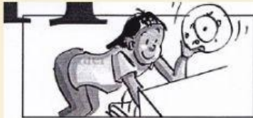
Noriko range la vaisselle dans le lave-vaisselle. Elle met la machine en marche.

Regarde bien les dessins. Puis, complète la liste de vocabulaire à la page suivante. Bekijk de tekeningen goed. Vul dan de woordenschatlijst aan op de volgende pagina.