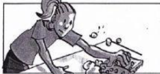
Linda nettoie la table avec une éponge.