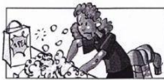
Jennifer lave le linge à la main avec de la lessive.