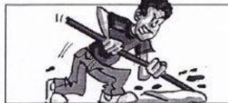
Luigi lave le sol. Il frotte fort avec un balai brosse et une serpillière. Le sol est très sale.