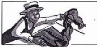
Il plie les chemises.