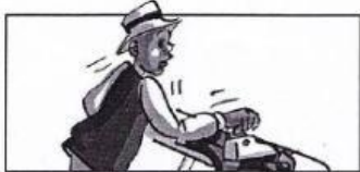
Lamine repasse les chemises. Il fait du repassage.