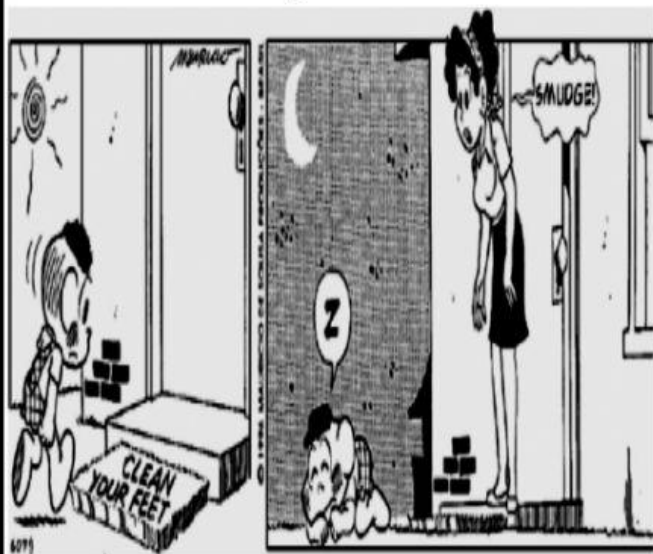
IMAGEM PARA AS QUESTÕES 1 E 2

1) Dê a tradução em português do que está escrito no tapete da entrada da casa: