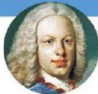
Felipe V (1701-1746)