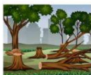
TALA DE ÁRBOLES