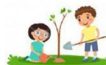
SIEMBRA DE ÁRBOLES

“CALIDAD DE VIDA A TRAVÉS DE LA GESTIÓN AMBIENTAL”