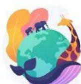
CONSERVACIÓN DE ESPECIES