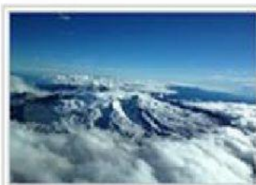
Volcán Nevado del Ruíz.

Volcán Nevado del Ruíz, Volcán Nevado Santa Isabel, Volcán Nevado del Tolima y Volcán Nevado del Huila.