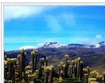
Nevado de Santa Isabel.