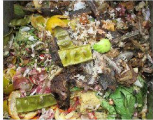
Sampah sisa makanan