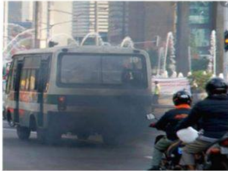
Penggunaan bahan bakar fosil pada kendaraan bermotor

Buatlah gagasan upaya penanggulangan perubahan iklim dengan memilih salah satu dari 4 fenomena penyebab perubahan iklim di bawah ini, lalu tuliskan gagasan dengan format yang disediakan di kolom jawaban!