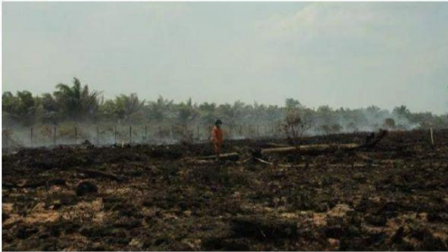
Ilustrasi kebakaran hutan dan lahan (Karhutla)

Isu perubahan iklim yang terjadi di bumi sudah tidak asing lagi didengar oleh kalangan masyarakat. Perubahan tersebut ditandai perubahan suhu, kelembaban dan curah hujan sehingga menyebabkan perubahan musim yang tidak menentu, kemarau dan kekeringan air terjadi dimanana-mana. Musibah Kebakaran hutan yang terjadi lahan di perkebunan PT. SIL 3 seluas 180 hektar, untuk PT. Indo Lampung seluas 30 hektar dan PTPN VII seluas 20 hektar. Sedangkan lahan PT. PML register 42 berjumlah 10 hektar dan PT. SIL 186,04 hektar Untuk lahan TNBBS seluas 100 hektar ada tahun 2019 lalu dipicu oleh kemarau yang panjang. hal tersebut mempunyai dampak yang besar terhadap ekosistem hutan yang mengakibatkan berkurangnya populasi dan keragaman spesies. Dalam hal ini salah satu spesies yang berkurang di Provinsi lampung adalah gajah sumatra ( Elephas maximus sumatrensis ) yang berkurang populasinya sekitar 69% karena kerusakan hutan tersebut (Maulina, Dina, dkk., 2019). Lalu bagaimana upaya kita dalam menanggulangi masalah perubahan iklim?