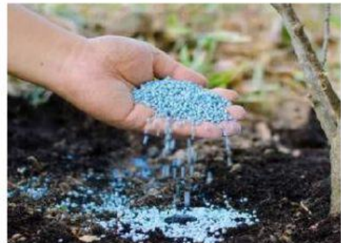
Penggunaan pupuk kimia

Tuliskan Gagasan penanggulangan perubahan iklim dengan memilih salah satu fenomena pada gambar di atas, kerjakan berdasarkan format berikut secara berkelompok !