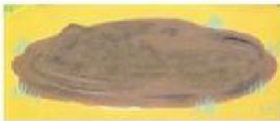
Laguna de barro