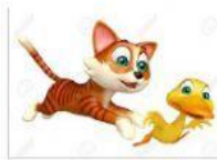
GATOS Y PATOS