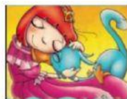
MONILDA Y GATOPATO