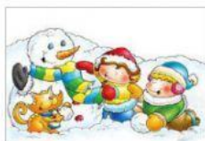
DON FRESQUETE Y LOS CHICOS