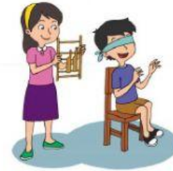
Medium Gas/ Udara