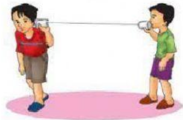
Medium Benda Padat

Bunyi merambat memerlukan medium/ media Perambatan bunyi dapat terjadi lewat medium baik padat, cair, atau gas. Namun bunyi tidak dapat merambat di ruang hampa, karena tidak ada medium di ruang hampa.