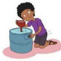
Medium Benda Cair