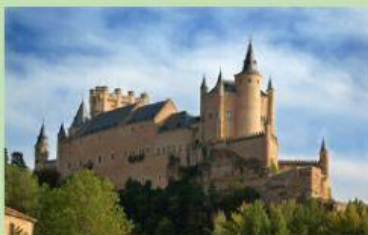
Королевский замок Алькасар