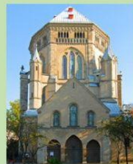
Собор в Сент-Олбанс