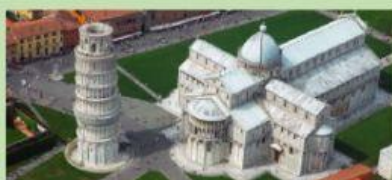
Собор Святой Марии Нуова