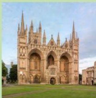
Собор в Питерборо