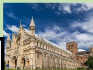
Церковь Святого Герона