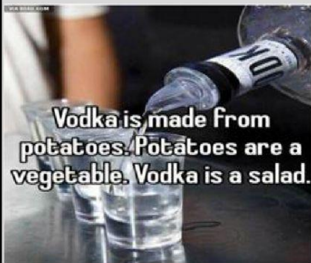
IMAGEM PARA A QUESTÃO 4

4) A descrição da Vodka feita pelo autor desconhecido da frase acima não passa de um argumento brincalhão para quem a lê. Podemos dizer que o autor quis: