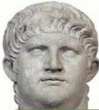
54 – 68