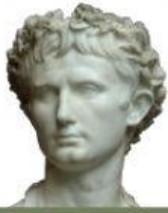
27 př. Kr. – 14 po Kr.

Přiřaď ke každému obrázku jméno a další dva pojmy