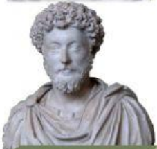
161 – 180