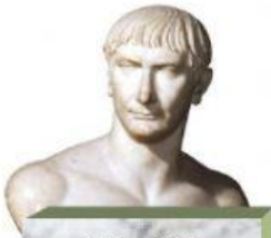
98 – 117