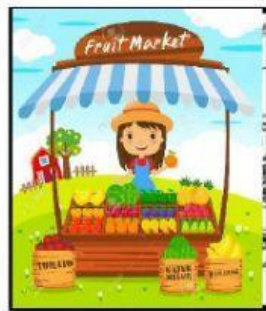
b) Al mercado