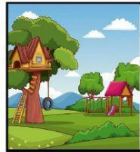
c) Al parque