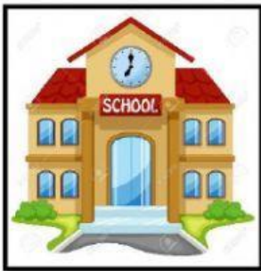
a) A la escuela