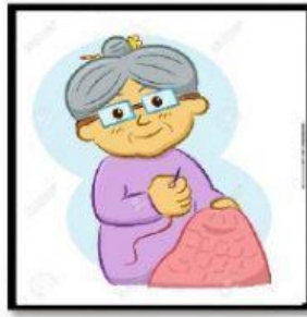
b) La abuelita