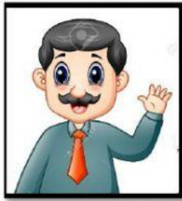
a) El papá